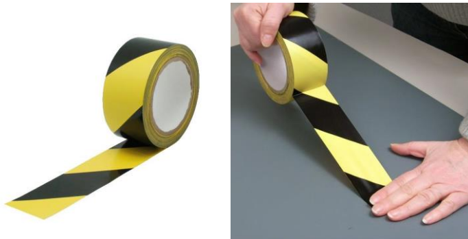
Référence : AG430-0001