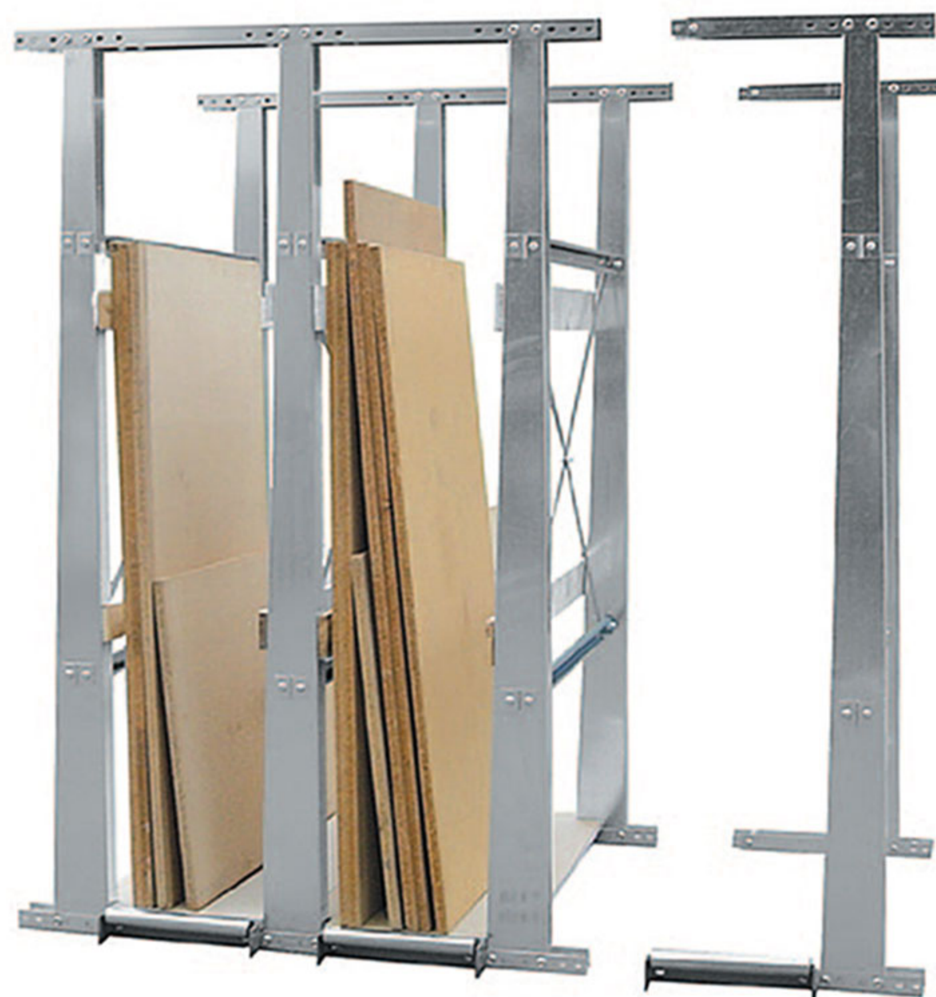
Unité de base